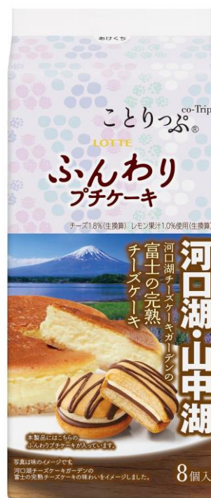
ことりっぷ ふんわりプチケーキ ＜河口湖チーズケーキガーデンの富士の完熟チーズケーキ＞