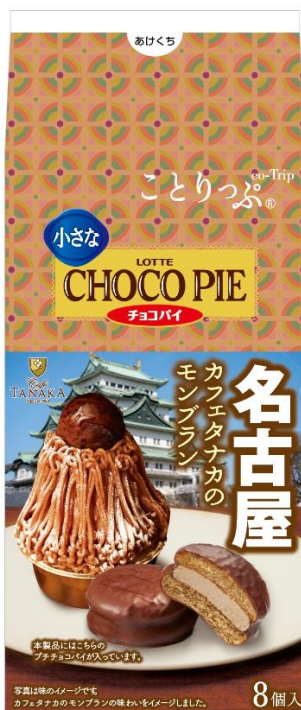
ことりっぷ 小さなチョコパイ ＜カフェタナカのモンブラン＞

株式会社昭文社発行の「ことりっぷ」を持って、まるでおうちにいながらも旅したような気分を疑似体験できるコラボレーション第8弾です。ぜひお楽しみください♪