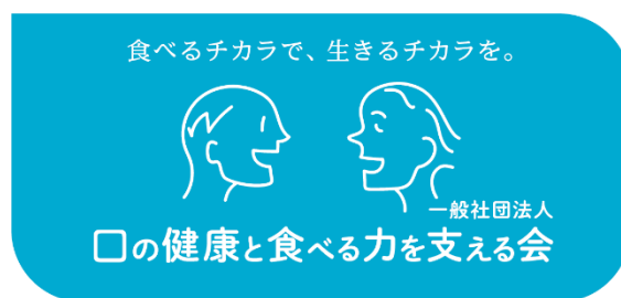
画像右 本会のロゴマークと口腔健康サポーターのロゴマーク