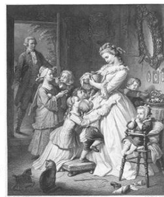
社名の由来である “若きウェルテルの悩み”のヒロイン 「シャルロット」