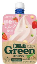
クーリッシュGreen ストロベリー