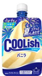
クーリッシュ バニラ<夏季限定>