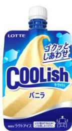
クーリッシュ バニラ

客室にあるクーリッシュ専用冷凍庫でいつでもお好きなタイミングで下記ラインナップをご賞味いただけます。