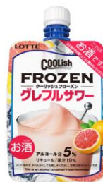
クーリッシュフローズン グレフルサワー