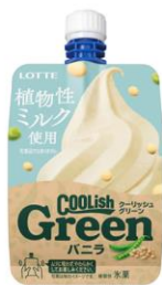
クーリッシュGreen バニラ