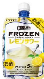
クーリッシュフローズン レモンサワー