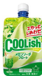
クーリッシュ メロンソーダフロート