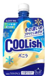
冬季限定<冬の濃いめ> ※2023年発売商品

「クーリッシュ バニラ」は、季節で氷のサイズや味わいを変えています。「夏のクーリッシュ部屋」では「通常 品質(春・秋)」、「夏季限定品質」、「冬季限定品質」の3つの「クーリッシュ バニラ」の飲み比べが可能です。 「夏季限定品質」は、春・秋に使用している微細氷と比較しサイズが大きく、より強い冷涼感とシャリツとし た食感が楽しめます。また、「冬季限定品質」については、春・秋よりも微細氷を小さくすることでマイルド な冷涼感と、よりなめらかな食感を楽しむことができます。違いをぜひ体感してみてください。