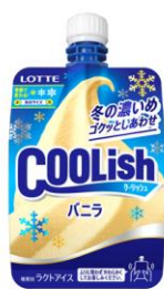
クーリッシュ バニラ<冬季限定> ※2023年冬季販売商品