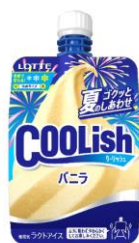
夏季限定<夏のゴックつしあわせ>