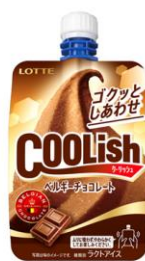
クーリッシュ ベルギーチョコレート