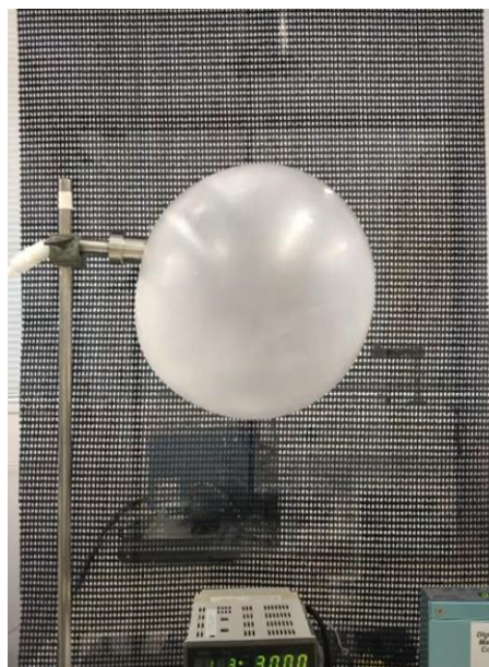
ロッテ独自開発の装置をつかって、窒素ガスでフーセンガムをふくらませた際の写真