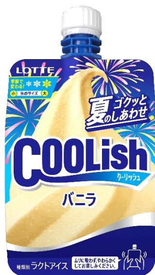
夏季限定＜夏の濃いめ＞ ※2024年夏季発売商品