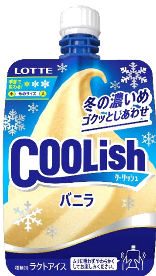
冬季限定＜冬の濃いめ＞