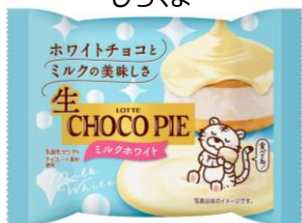
ホワイトタイガー