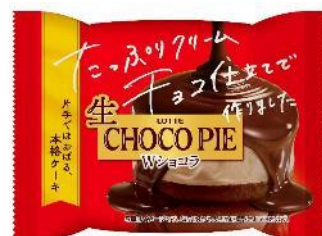
生 チョコパイ<Wショコラ>