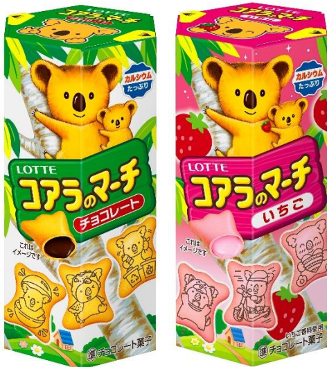
コアラのマーチ<チョコ>