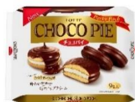
チョコパイパーティーパック

2020年から本取り組みを段階的に進め、トレーの厚みを0.35mmから0.31mmに変更し、プラスチック使用量を約11%の削減(注2)を実現しました。今回の変更では、耐衝撃強度を保つため、トレー側面の縦線（リブ）の本数を増やし、横方向の段差をあらたに追加しています。本取り組みによる原料の削減量としては年間約83.0トン(注3)見込んでいます。注2、注3 2019年製品基準比