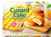
カスタードケーキパーティーパック