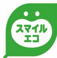
スマイルエコラベル

ロッテは、環境に配慮する取り組みを、お客さまにわかりやすく伝えるため、「スマイルエコラベル」を製品の容器や包装に順次表示しています。当社独自の環境配慮基準をクリアした製品が対象で、当該リリースに掲載の製品にも順次表示していきます。